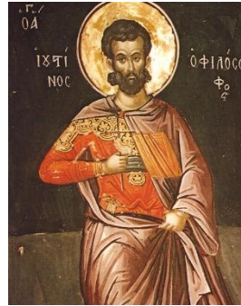
▲ローマの致命者 哲学者聖イウスチン